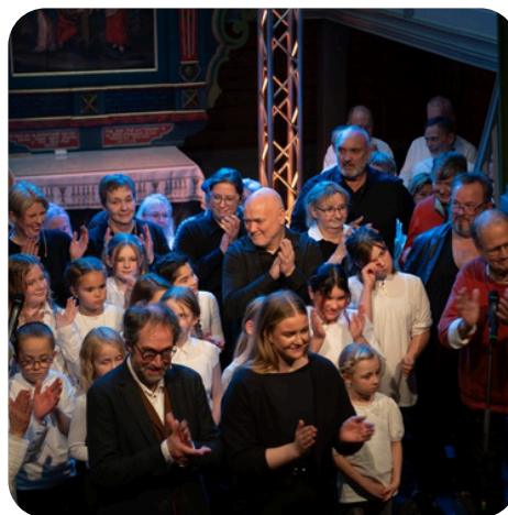
Vind- 200-års jubileumsforestilling for Bø kirke 2024.