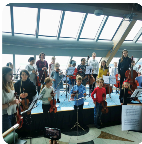
Konsert med unge strykere på hurtigrutetur mellom Sortland og Stokmarknes.