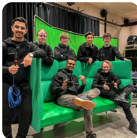
Vesterålen Hub arrangerte Stream Lab ved LoveLan 2023 i samarbeid med Hadsel Videregående skole.