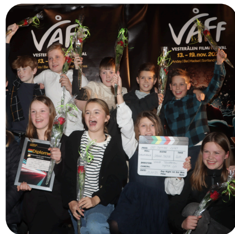
Vinnere fra Maurnes Skole, Filmfest 2023