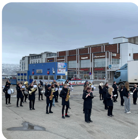
:Sortland Juniorkorps og Stokmarknes skolekorps spilte på Sortland torg i forkant av felles møte.