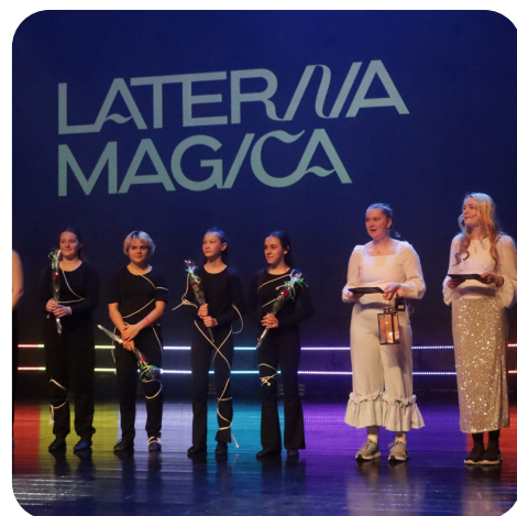
Deltakere ved filmfestshowet 2023

Laterna Magica søker ekstern finansiering fra aktører som Arktisk Film Norge AS Nordland fylkeskommune, Samfunnsløftet, i tillegg til lokale sponsorer.