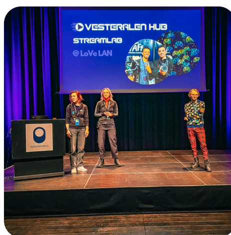
Presentasjon av satsningen i forbindelse med Bodø 2024 Ung Nettverkssamling i Vesterålen.