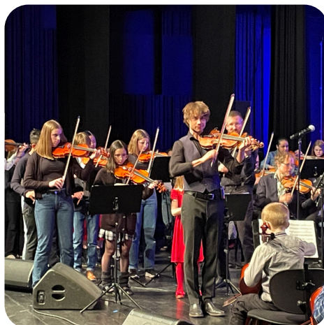
Strykersamling i Vesterålen med Alexander Rybak ved Kulturfabrikken Sortland.