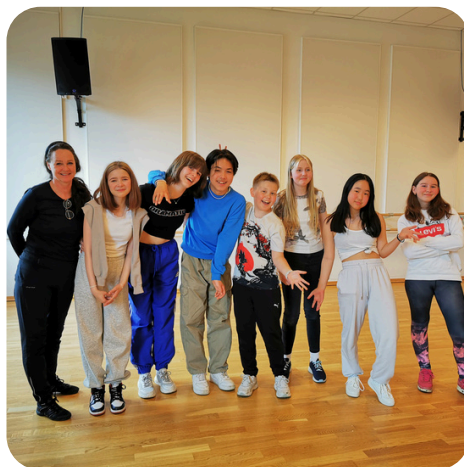
Fordypning dans ved Øksnes kulturskole

Videreutvikle ny strategiplan i samarbeid med styret og representantskap for Vesterålen kultursamarbeid.