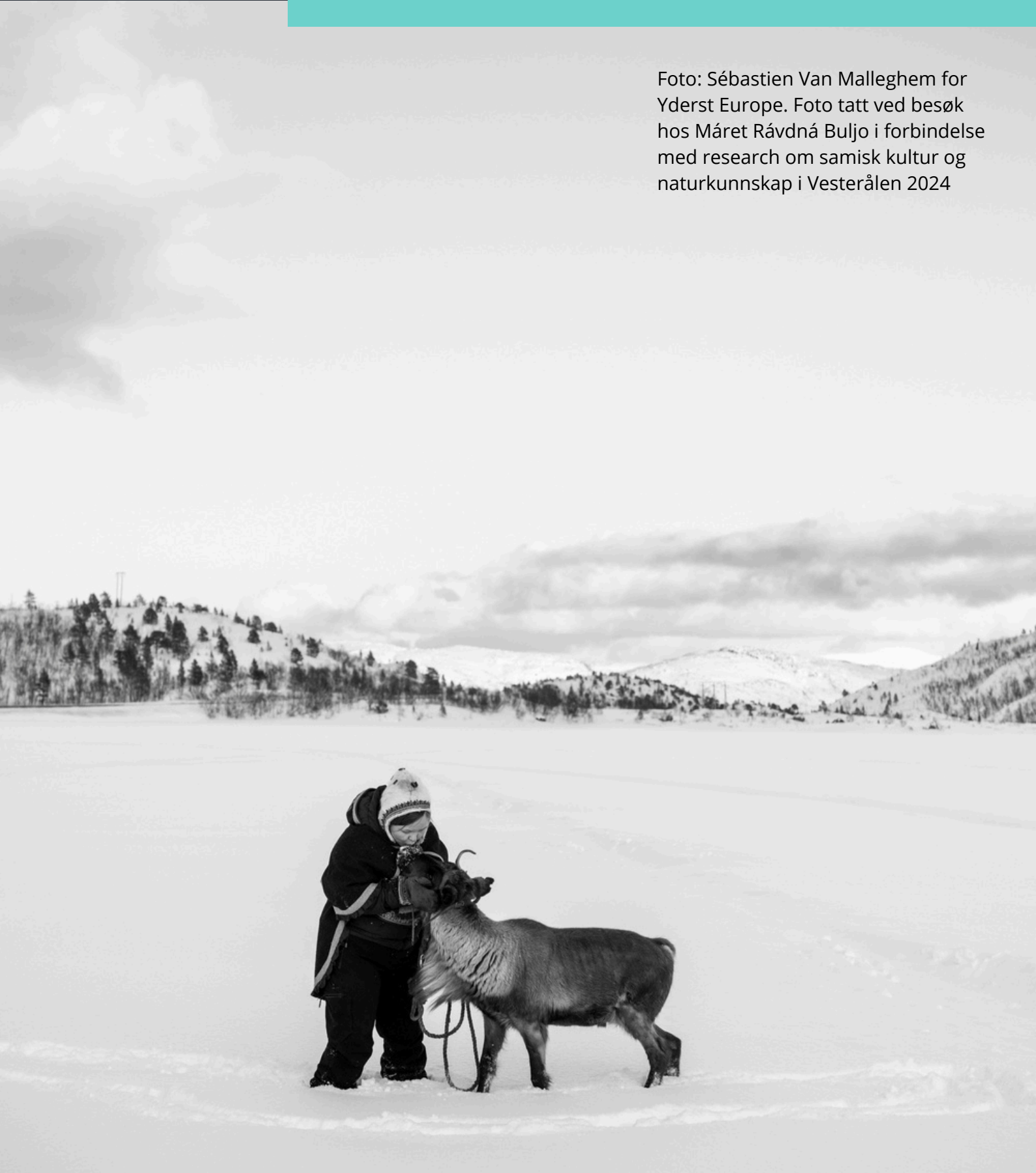
Foto tatt ved besøk hos Máret Rávdná Buljo i forbindelse med research om samisk kultur og naturkunnskap i Vesterålen 2024