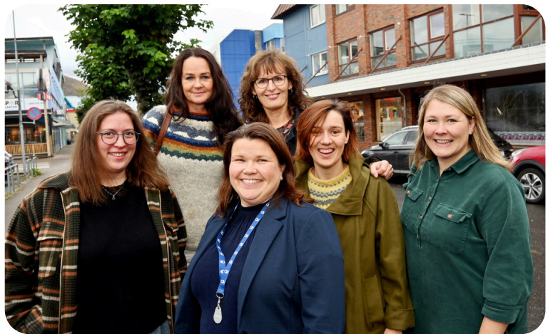
Deler av MUSAM- kollegiet samlet til felles møte på Sortland høsten 2022.

MUSAM er et samarbeidsorgan for kulturskolene i Vesterålen og Musikk- Dans og dramalinjen ved Sortland videregående skole. Kultursamarbeidet har en 30% koordinatorstilling som arrangerer fellesmøter for kulturskolerektorer og avdelingsledere ved Musikklinja på Sortland. MUSAM er et viktig nettverk for kulturskoleledere, og en arena for samarbeid, utvikling og kompetansebygging mellom kulturskolene i Vesterålen og mellom kulturskolene og videregående skole i Vesterålen.