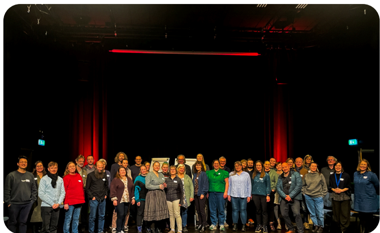
Kulturskolene lærere fra Vesterålen og Lofoten samlet til felles fagdag og Utopiverksted ved Kulturfabrikken i november 2024